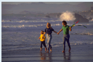
Отдыхают, гады. :(

возможно создание грабера для извлечения музыки из NES-ромов. С искусственным интеллектом. Ха-ха. Всего на данный момент 3 файла: файл эмулятора, файл с кодом ядра 6502 и файл с функциями загрузки картриджей. Ошибок и багов мо-