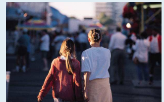
Это самые обычные люди

На этот раз это всё. Статьи еще более качественные. Внимательно их прочтите. В них даже нет ошибок.